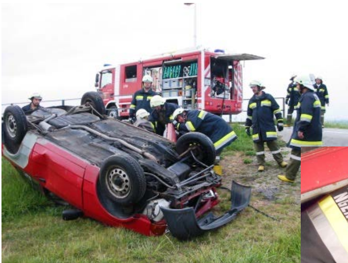
Fotos von Übungen